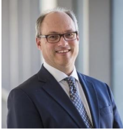
Dr. Ivy Dunbar Children's Hospital, Denver Colorado, Estados Unidos